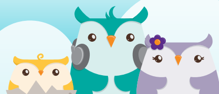
Tableau des primes

La prime reste la même, peu importe l'âge et le sexe de l'enfant. Elle est garantie jusqu'à 75 ans. Le capital assurable varie de 10 000 $ à 50 000 $ par tranche de 5 000 $.